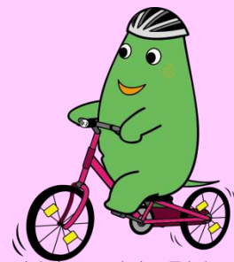
大和市イベントキャラクター 「ヤマトン」

発行日：平成28年5月20日 編集：渋谷土地区画整理事務所 242-8601 大和山下鶴間1丁目1番1号 (事業管理課事業管理担当)