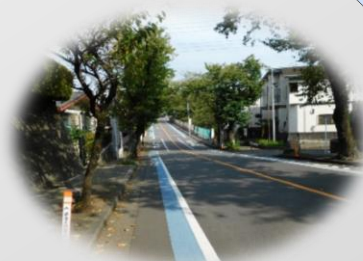
“想祖孙三代一起步行的街道”