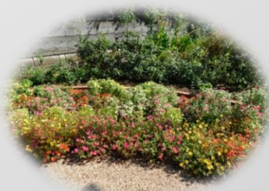
“能感觉四季的街道风景”