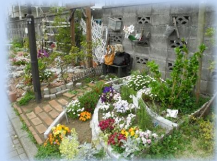
第17届街道规划奖获奖案例

街道规划奖作为一个以市民为主体来进行街道规划的城建启蒙项目，表彰市内有关街道规划的卓越尝试（包括活动和案例），其目的是以此来促进建设舒适的街道环境并创造出具有大和市特色的街道风貌。欢迎大家踊跃应征。