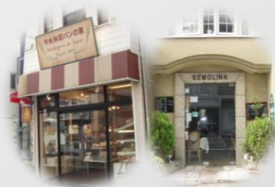
“有特色门牌的街道风景”