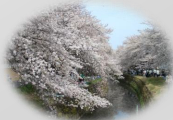
“举办愉快活动的街道风景”