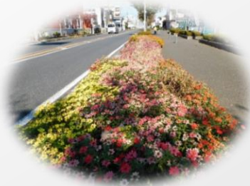
“跟当地居民相遇的街道”