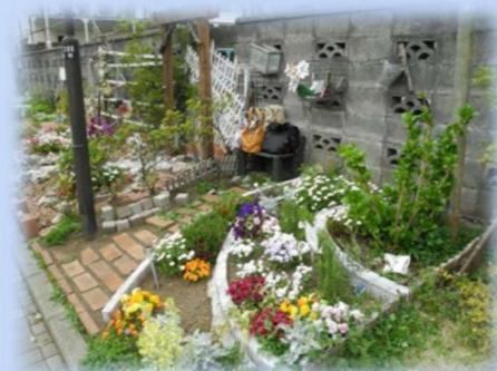
第17回街づくり賞受賞事例

街づくり賞は、市民による主体的な街づくり活動の啓発事業として、市内の街づくりに関する優れた取り組み（活動や事例）を表彰し、快適な街づくりの推進や大和らしい街の創造へつなげていくことを目的としています。ご応募お待ちしております。