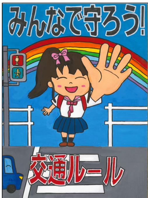
交通安全部門 最優秀賞 福田小 5年 鈴木 遙