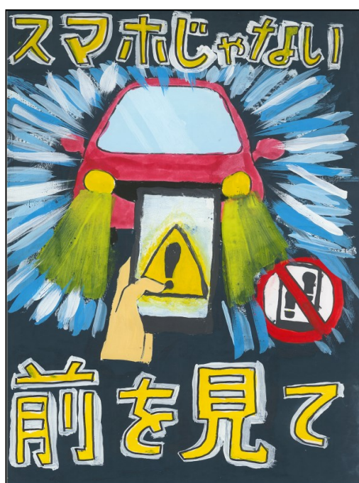
歩きスマホ防止部門 最優秀賞 緑野小 6年 足立 陽香