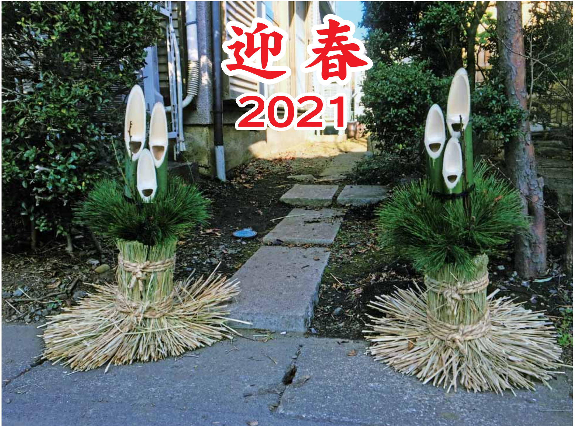
「笑福万人来 正月の門松」 場所：自宅門入口（市内）

第303号 令和3年(2021年)1月1日 【編集】 広報委員会 【発行】 大和市議会