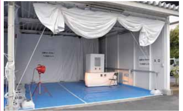
大和ウォークスルーPCR検査プレイス