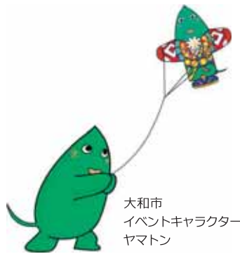
大和市 イベントキャラクター ヤマトン