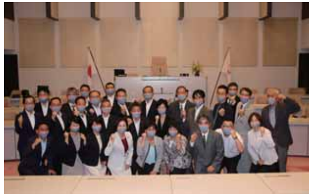
頑張れ大和シルフィード!

令和元年度各会計決算をはじめ、令和2年度一般会計補正予算など議案32件、陳情3件、議員提出議案5件を審議しました。