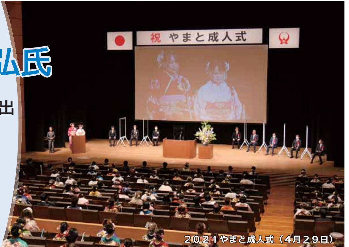
2021 やまと成人式 (4月29日)

今臨時会には、市長から提出された専決処分の承認についての報告2件(訴訟上の和解、令和3年度大和市一般会計補正予算(第1号))をそれぞれ全員賛成で承認し、副市長の選任についての議案を全員賛成で同意しました。