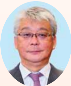
副議長 青木 正始

地の問題については、平成30年に空母艦載機部隊が移駐したことで航空機騒音は減少していますが、基地に起因する諸問題や今後の運用など、引き続き動向を注視してまいります。