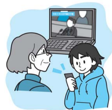
市議会インターネット映像配信ページへ