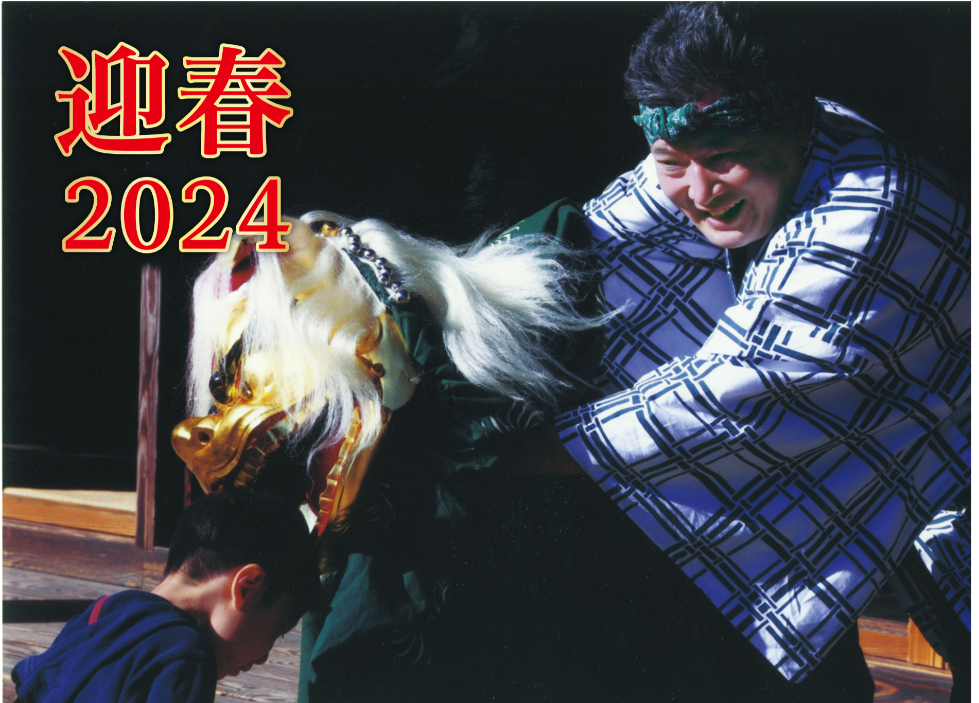
「獅子舞の新春祈願」 場所：大和市郷土民家園