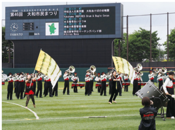
4年ぶりに通常開催された大和市民まつり