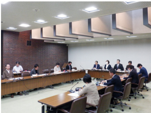
「前市長による公共工事のやり直しに関する調査特別委員会」

令和5年度一般会計補正予算など議案9件、請願5件、陳情2件、おもいやりマスク着用条例を廃止する条例など議員提出議案3件を審議しました。