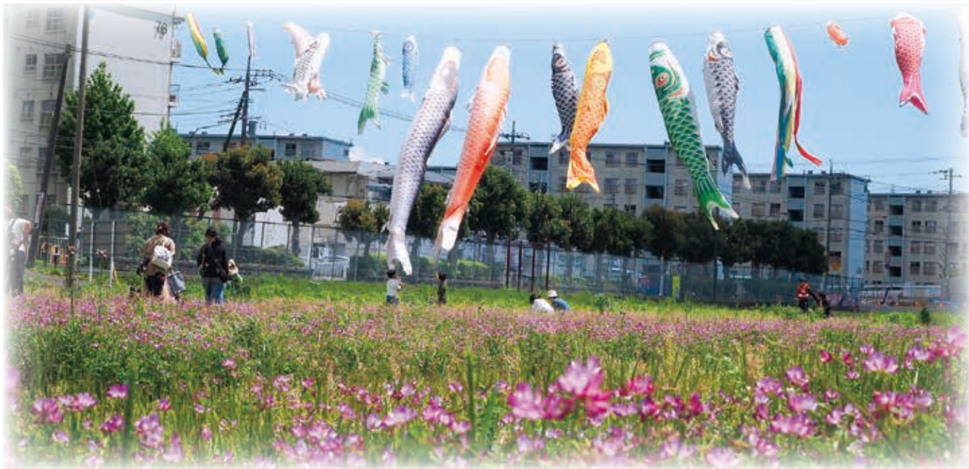
やまとふれあいの里レンゲまつり(下和田地区の水田にて)