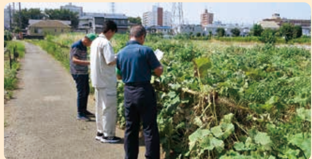
農地パトロールの様子