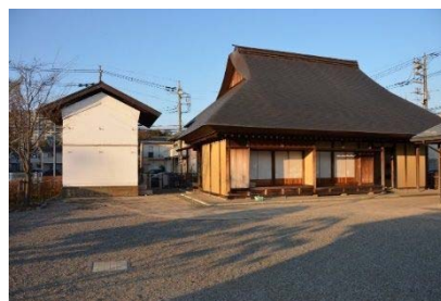
下鶴間ふるさと館

[事業内容] 郷土学習の場となるよう、企画展・年中行事などの企画事業を行いました。