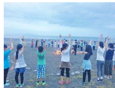
わくわく冒険隊宿泊研修

[事業内容] 青少年が自主性や協調性を養えるようなさまざまな社会体験や自然体験などができる講座やイベント等を開催しました。