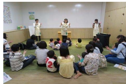
図書館でのおはなし会

[事業内容] 図書館及び保育園などにおいて乳・幼児を 対象としたおはなし会を開催しました。 ブックスタートなど、乳幼児と保護者に本との 出会いや親しむ機会を提供しました。