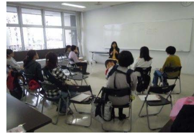
幼児家庭教育セミナー

[事業内容] 乳・幼児期に関する講座等を開催しました。 学級や講座を増やすとともに、交流の場となる 保育室の開放を行いました。