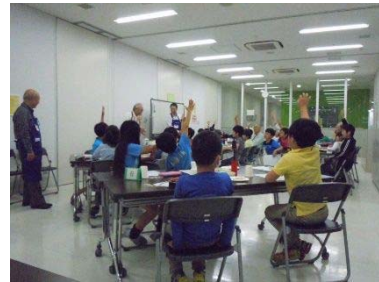
子ども科学講座理科実験コース 電話はなぜ聴こえるのかな？

[事業内容] 青少年が自主性や協調性を養えるようなさまざまな社会体験や自然体験などができる講座やイベント等を開催しました。