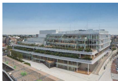
文化創造拠点シリウス

[事業内容] 多様な学習活動や文化芸術の振興に対応する生涯学習施設が整備されました。