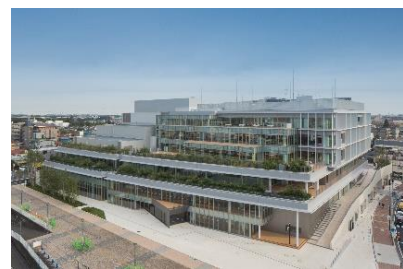
文化創造拠点シリウス

[事業内容] 多様な学習活動や文化芸術の振興に対応する生涯学習施設が整備されました。