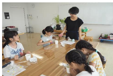
小学生なつやすみ体験講座

[事業内容] 青少年が自主性や協調性を養えるようなさまざまな社会体験や自然体験などができる講座やイベント等を開催しました。