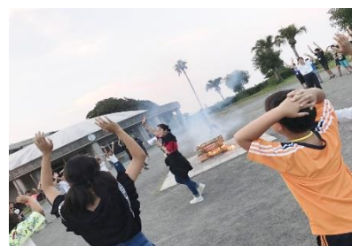
わくわく冒険隊宿泊研修

[事業内容] 青少年が自主性や協調性を養えるようなさまざまな社会体験や自然体験などができる講座やイベント等を開催しました。