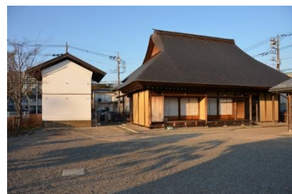
下鶴間ふるさと館

[事業内容] 郷土学習の場となるよう、企画展・年中行事などの企 画事業を行いました。