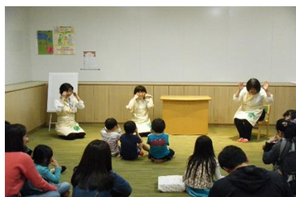
こどもの読書週間とくべつおはなし会

[事業内容] 図書館及び保育園などにおいて乳・幼児を対象としたおはなし会を開催しました。 ブックスタートなど、乳幼児と保護者に本との 出会いや親しむ機会を提供しました。