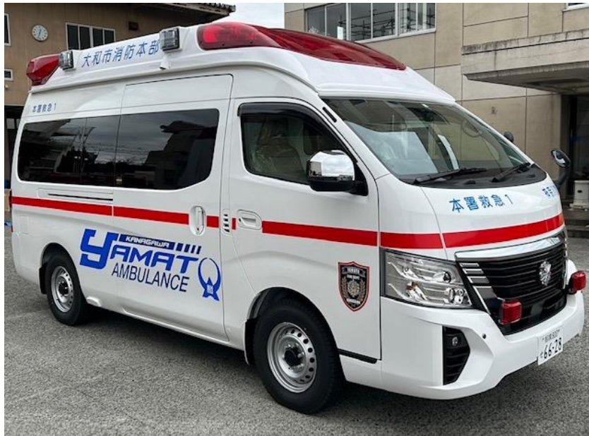
【令和4年度更新車両 本署高規格救急自動車】