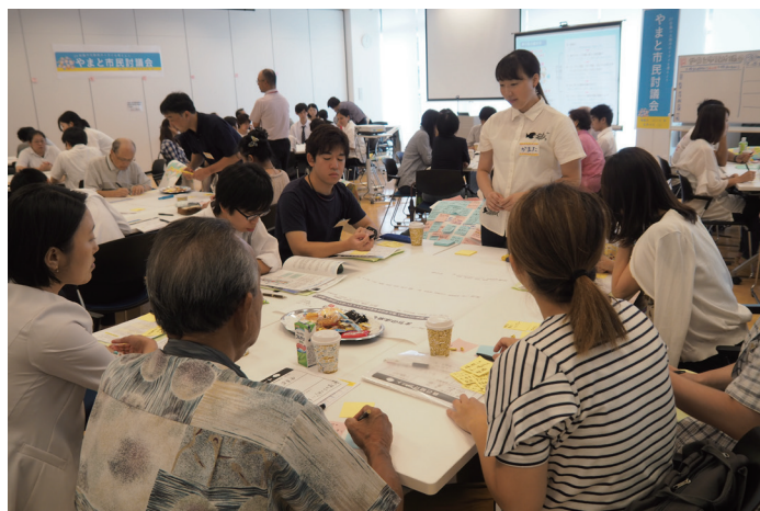
市民討議会の様子