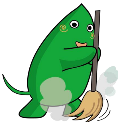
大和市イベントキャラクター ヤマトン