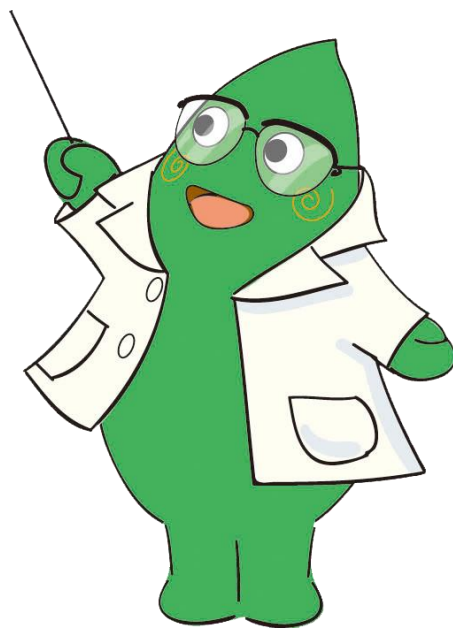
大和市イベントキャラクター ヤマトン

「市民参加」や「情報提供」を十分に推進しているかどうか、また社会問題意識として「ユニバーサルデザインへの対応」、「環境負荷軽減に向けた取り組み」についても評価を行い、93.7%の事業で「社会的配慮を十分行っている」と評価しています。しかし、6.3%の事業について、まだ不十分であると評価しています。コスト削減や事業の成果だけに捉われることなく、社会的な配慮についても、十分検討し、配慮することは行政に求められている大きな課題の一つです。