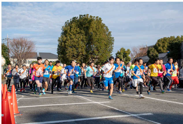
大和市駅伝競走大会