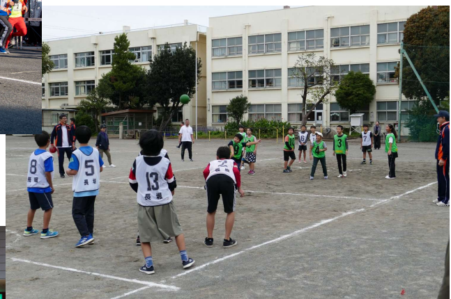
大和地区小学生スポーツ大会(ドッジボール)