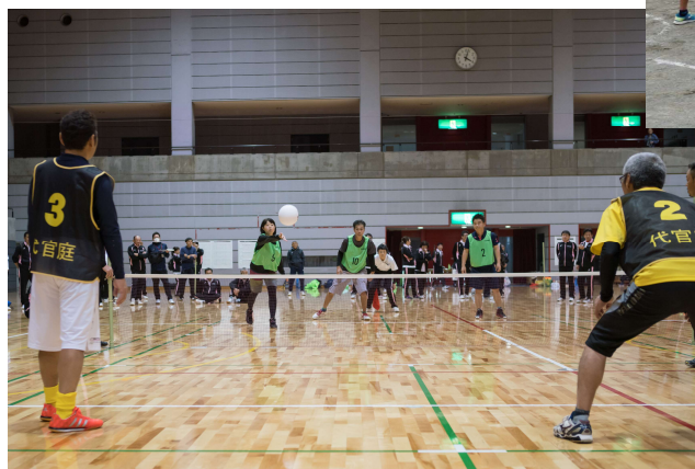
親善球技大会(バウンズボール)