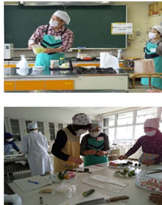
《おやこの食育教室》