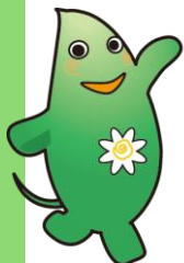
大和市イベント キャラクター ヤマトン

これまで多くの方にご利用いただけてきましたが、このたび、更に便利にご利用いただけるように、新しいシステムに移行します。 つきましては、現行の公共施設予約システムで予約機能をご利用中の方に、新システムでのご利用開始に向けて必要となるメールアドレス等の利用者情報の登録をお願いしております。