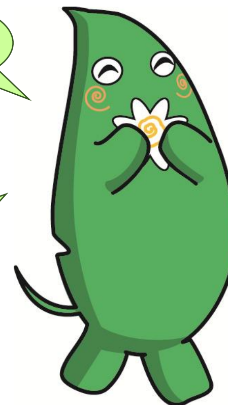
大和市イベントキャラクター ヤマトン