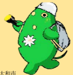
大和市 イベントキャラクター ヤマトン